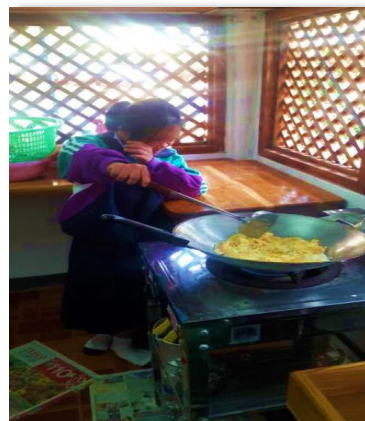
ภาพที่ 31, 32 นักเรียนที่บกพร่องทางสติปัญญา ระดับชั้นประถมศึกษาเรียนรู้การประกอบอาหาร อันเป็นพื้นฐานในการรู้จักทำงาน และทักษะการดำรงชีวิต