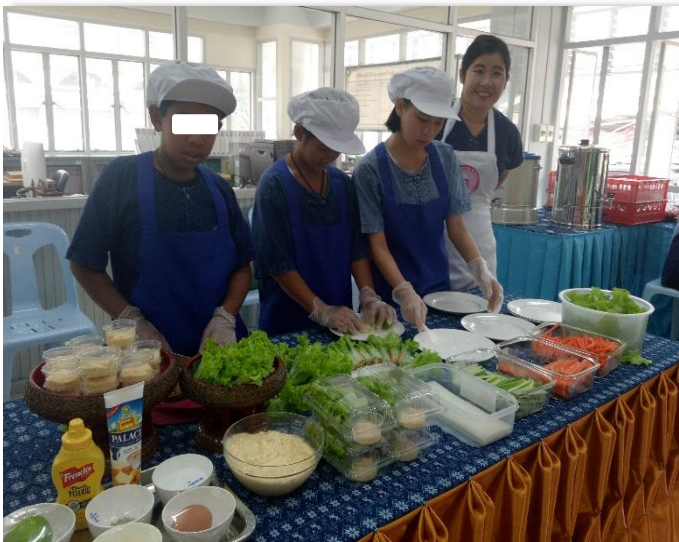
ภาพที่ 42 การนำนักเรียนที่บกพร่องทางสติปัญญา ระดับเล็กน้อย เข้าเรียนหลักสูตรอาชีพพระยะสั้นกับวิทยาลัยสารพัดช่าง เป็นอีกแนวทางที่ช่วยเสริมสร้างทักษะและประสบการณ์อาชีพจากผู้เชี่ยวชาญ ให้กับนักเรียน

การพัฒนาทักษะอาชีพด้วยหลักสูตรวิชาชีพพระยะสั้น ดำเนินการได้โดยสถานศึกษา ประสานความร่วมมือกับสถานศึกษาสังกัดอาชีวศึกษาใกล้เคียง อาทิเช่น วิทยาลัยการอาชีพ วิทยาลัยเทคนิค วิทยาลัยเกษตรและเทคโนโลยี วิทยาลัยสารพัดช่าง เป็นต้น เพื่อร่วมกันในการจัดการเรียน การสอนหลักสูตรวิชาชีพพระยะสั้นเพิ่มเติมตามความสนใจของผู้เรียนจากที่สถานศึกษาสามารถ ดำเนินการเสริมทักษะและสร้างเสริมประสบการณ์อาชีพภายในสถานศึกษา เพื่อเปิดโอกาสให้นักเรียน ได้เสริมสร้างทักษะและฝึกประสบการณ์อาชีพจากผู้ที่มีความรู้ความเชี่ยวชาญเพิ่มเติมในอาชีพต่าง ๆ