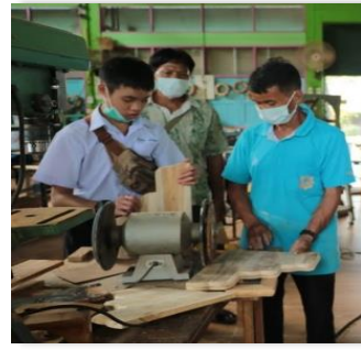
ภาพที่ 33, 34 การจัดกิจกรรมให้กับนักเรียนที่บกพร่องทางสติปัญญาในระดับเล็กน้อย ระดับชั้นมัธยมศึกษาตอนต้น ได้รับประสบการณ์จริงในการฝึกทักษะอาชีพ

ระดับมัธยมศึกษาตอนปลาย เตรียมนักเรียนเข้าสู่การประกอบอาชีพ (Career Preparation) ศึกษาต่อในสาขาอาชีพที่ตนถนัด สถานศึกษาควรจัดหลักสูตรและการเรียนการสอนเพื่อวางพื้นฐานความรู้ และทักษะทางอาชีพเฉพาะทางมากขึ้น โดยอาจจัดให้เป็นแผนการเรียนที่มีจุดเน้นและเป้าหมายที่ชัดเจน เพื่อให้นักเรียนได้เลือกเรียนตามความถนัดและความต้องการของตน มีโอกาสได้รับประสบการณ์และฝึกทักษะทางอาชีพ รวมถึงการปรับตัวเข้ากับอาชีพ (Career Assimilation) โดยทดลองฝึกปฏิบัติงานในสถานการณ์จริงหรือ สถานการณ์จำลองทั้งในและนอกสถานศึกษา