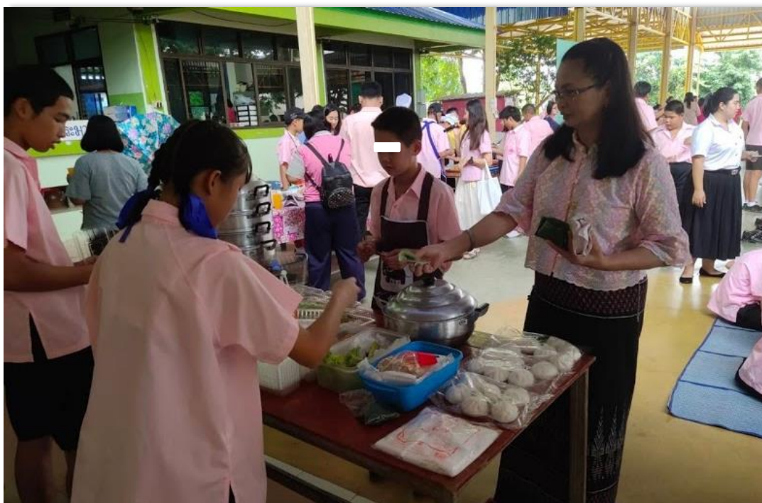
ภาพที่ 39 การจัดกิจกรรมตลาดนัดอาชีพ เพื่อเปิดโอกาสให้นักเรียนได้เรียนรู้การจำหน่ายสินค้า และผลิต จากสถานการณ์จริง เป็นการเพิ่มพูนทักษะในการทำงานอาชีพให้สูงขึ้น

นอกจากนี้สถานศึกษายังสามารถจัดสอนเสริมทักษะอาชีพให้กับนักเรียนได้ในชั่วโมงลดเวลาเรียน เพิ่มเวลารู้ ชั่วโมงกิจกรรมชุมนุม กิจกรรมต่าง ๆ ที่สถานศึกษาจัดขึ้นเพื่อบูรณาการความรู้ในทักษะต่าง ๆ เข้าด้วยกันตามความพร้อมและจุดเน้น เพื่อให้นักเรียนได้เรียนรู้ผ่านกระบวนการหรือสถานการณ์จำลอง เช่น กิจกรรมตลาดนัดอาชีพ กิจกรรมเปิดบ้านวิชาการและงานอาชีพ เป็นต้น หรือใช้เวลาว่างที่นักเรียนพักอาศัยอยู่ในหอนอน ในวันหยุด เนื่องด้วยนักเรียนส่วนมากได้พักอาศัยประจำอยู่ในหอนอนของโรงเรียนอยู่แล้ว เพื่อพัฒนานักเรียนให้มีความรู้ความสามารถ และทักษะในการปฏิบัติงานและการประกอบอาชีพ รวมถึงการปลูกฝังลักษณะนิสัยในการทำงาน นำไปสู่การมีงานทำหรือการประกอบอาชีพได้