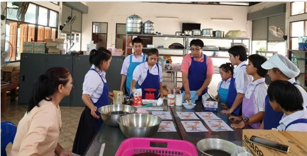
ภาพที่ 40 การเรียนรู้งานอาชีพการทำขนม จากฐานการเรียนรู้อาชีพที่โรงเรียนจัดขึ้น โดยมีครูคอยให้ความรู้ และดูแลอยู่ประจำฐาน

สถานศึกษาสามารถนำรายวิชาพื้นฐานอาชีพ รายวิชาเพิ่มเติมอาชีพ มาจัดการเรียนรู้ โดยมีเนื้อหาที่สอดคล้องกับฐานการเรียนรู้ที่มีในสถานศึกษา หรือใช้ฐานการเรียนรู้อาชีพเป็นแหล่งเรียนรู้ อาชีพตามความสนใจหรือความเหมาะสมในศักยภาพที่นักเรียนจะเรียนรู้ได้ โดยจัดแผนการจัดการเรียนรู้ ที่สอดคล้องกับฐานการเรียนรู้ เตรียมให้นักเรียนได้เรียนรู้และฝึกปฏิบัติงานอาชีพในฐานการเรียนรู้ ที่จัดเตรียมไว้ อาจหมุนเวียนกลุ่มนักเรียนเข้าศึกษาหาความรู้จากฐานการเรียนรู้ ปฏิบัติกิจกรรมต่าง ๆ ตามแต่ละฐานการเรียนรู้ภายใต้การดูแลของครูหรือผู้ที่มีหน้าที่ ประจำฐานการเรียนรู้ที่จะให้คำแนะนำ อำนวยความสะดวกในการเรียนรู้และประเมินผลการเรียนรู้ของนักเรียน