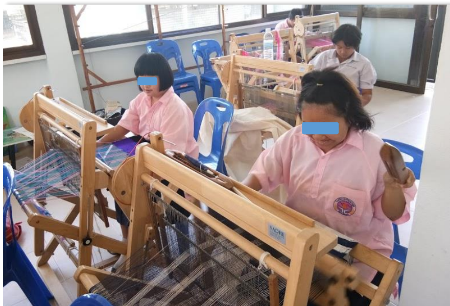
ภาพที่ 37 นักเรียนที่บกพร่องทางสติปัญญาเรียนรายวิชาเพิ่มเติม ทักษะอาชีพการทอผ้าซาโอริ ซึ่งเป็นวิชาที่เลือกเรียนตามความสนใจของตนเอง

3.2.1 จัดเป็นรายวิชาเพิ่มเติมอาชีพให้นักเรียนได้เลือกเรียนในแต่ละรายวิชาตามความสนใจหรือความเหมาะสมกับสภาพความพิการของนักเรียน (Shopping Course) เพื่อให้ นักเรียนได้เรียนรู้ในภาคของการปฏิบัติ ฝึกทักษะที่จำเป็น และคุณลักษณะที่สำคัญจำเป็นต่ออาชีพที่สามารถเรียนรู้ได้จบภายในรายวิชานั้น ๆ ซึ่งอาจจะจัดเป็นรายภาคเรียน เพื่อให้นักเรียนได้มีโอกาสเรียนรู้ สำนวญ ทดลอง เพื่อการค้นพบความถนัด ความเหมาะสมหรือความสนใจทางอาชีพของตนเอง เช่น รายวิชาการทอผ้าซาโอริ การทำขนมอบ ช่างไม้ การปลูกผัก งานจักสาน เป็นต้น