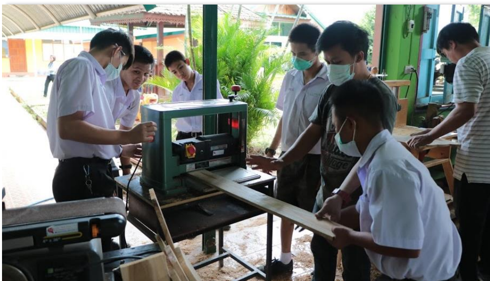
ภาพที่ 38 การจัดการเรียนทักษะอาชีพ วิชางานไม้ ให้นักเรียนได้เรียนรู้ตลอดปีการศึกษา เพื่อการฝึกฝนทักษะให้ชำนาญ มุ่งสู่อาชีพที่ตนสนใจโดยเฉพาะ

2) ชุดรายวิชาที่มุ่งสู่อาชีพเฉพาะ เป็นรายวิชาที่ให้นักเรียนได้เรียนรู้ในภาคของการฝึกปฏิบัติ และฝึกทักษะ รวมถึงการเตรียมคุณลักษณะที่จำเป็นต่ออาชีพที่เรียน โดยสถานศึกษาจัดเป็นชุดรายวิชาให้นักเรียนได้เลือกเรียนรายวิชาในชุดนั้นให้เกิดความรู้ ความชำนาญในทักษะความสามารถ จากการฝึกปฏิบัติ ฝึกทักษะเพื่อนำไปสู่การประกอบอาชีพเพื่อหารายได้ทั้งในระหว่างเรียนและเมื่อจบการศึกษาออกไป เช่น ชุดรายวิชา การทอผ้าซาโอริ 1, การทอผ้าซาโอริ 2, ชุดรายวิชา การย้อมผ้าหม้อห้อม 1, การย้อมผ้าหม้อห้อม 2, ชุดรายวิชา งานไม้ 1, งานไม้ 2, งานไม้ 3, งานไม้ 4 เป็นต้น โดยแต่ละอาชีพอาจใช้เวลาเรียน 1 ภาคเรียนหรือตลอด 1 ปีการศึกษา