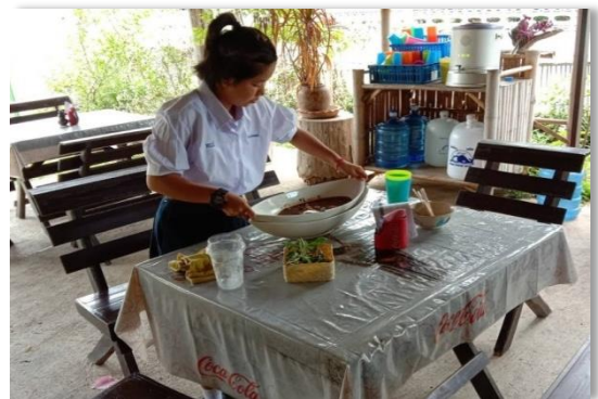
ภาพที่ 36 นักเรียนที่บกพร่องทางสติปัญญา ระดับชั้นมัธยมศึกษาตอนปลายฝึกงานที่ร้านอาหารในชุมชนใกล้โรงเรียน