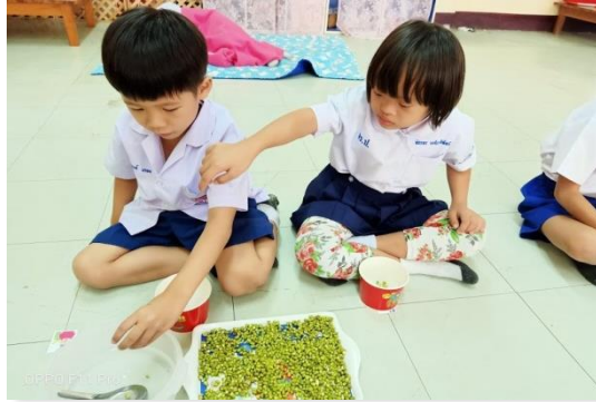
ภาพที่ 30 การจัดประสบการณ์ สำหรับนักเรียนระดับปฐมวัย ให้ได้เล่นหรือทำกิจกรรมร่วมกัน เป็นการเตรียมความพร้อมด้านร่างกาย อารมณ์ สังคม และด้านสติปัญญา

ระดับประถมศึกษา เป็นการจัดกิจกรรมการเรียนการสอน และกิจกรรมแนะแนว ให้นักเรียนรู้จักอาชีพ และเห็นความสำคัญของอาชีพ (Career Awareness) ทั้งอาชีพของครอบครัว อาชีพในชุมชน อาชีพในท้องถิ่น อาชีพภายในประเทศ รวมทั้งการแนะนำอาชีพ หรือปฐมนิเทศอาชีพ (Career Orientation) ให้นักเรียนมีความรู้เบื้องต้นเกี่ยวกับการทำงาน รู้จักใช้เครื่องมือง่าย ๆ ในการทำงาน และสามารถทำงานด้วยกระบวนการที่ไม่ซับซ้อนได้ สร้างเสริมลักษณะนิสัยในการทำงานที่พึงประสงค์ ทำงานที่ได้รับมอบหมายด้วยความรับผิดชอบ ขยัน อดทน ซื่อสัตย์ ประหยัด และอดออม รวมถึงการใช้พลังงาน ทรัพยากรธรรมชาติ และสิ่งแวดล้อม อย่างประหยัด คุ่มค่า และถูกวิธี เพื่อเป็นพื้นฐานสู่การเรียนอาชีพ และการฝึกทักษะอาชีพในระดับที่สูงขึ้น