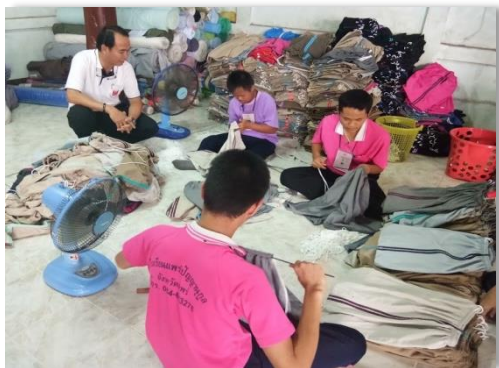
ภาพที่ 35 นักเรียนที่บกพร่องทางสติปัญญา ระดับชั้นมัธยมศึกษาตอนปลายฝึกงานที่ร้านตัดเย็บเสื้อผ้าในชุมชน

ระดับมัธยมศึกษาตอนปลาย เตรียมนักเรียนเข้าสู่การประกอบอาชีพ (Career Preparation) ศึกษาต่อในสาขาอาชีพที่ตนถนัด สถานศึกษาควรจัดหลักสูตรและการเรียนการสอนเพื่อวางพื้นฐานความรู้ และทักษะทางอาชีพเฉพาะทางมากขึ้น โดยอาจจัดให้เป็นแผนการเรียนที่มีจุดเน้นและเป้าหมายที่ชัดเจน เพื่อให้นักเรียนได้เลือกเรียนตามความถนัดและความต้องการของตน มีโอกาสได้รับประสบการณ์และฝึกทักษะทางอาชีพ รวมถึงการปรับตัวเข้ากับอาชีพ (Career Assimilation) โดยทดลองฝึกปฏิบัติงานในสถานการณ์จริงหรือ สถานการณ์จำลองทั้งในและนอกสถานศึกษา