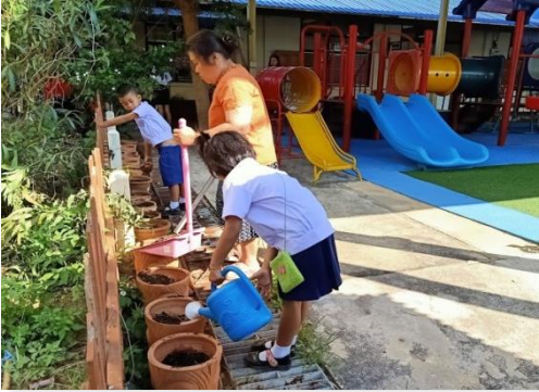
ภาพที่ 29 นักเรียนระดับปฐมวัย ช่วยคุณครูรดน้ำเตรียมดินเพื่อปลูกผัก เป็นการเตรียมนิสัยรักการทำงานเมื่อโตขึ้น